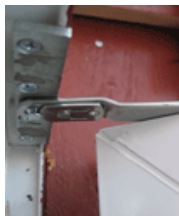
Friktionsbroms 200 kr Passar till utåtgående dörrar.