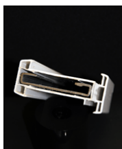
Skarvregel 370 kr/m 20 mm stålregel med ett yttre hölje av PVC.