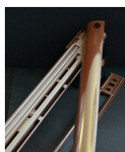
Chokladbrun spaltventil 470kr EMM-747. Ral nr 8017