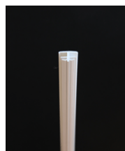
Skarvlist 80 kr/m 2 mm h-list i PVC, skarvar på insida och utsida