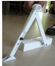
Dörrstängare med stopp 1.050 kr Passar till utåtgående dörrar.