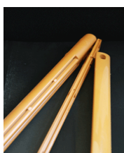
Ljusbrun spaltventil 470kr EMM-787. Ral nr 8001