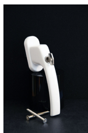
Vitt handtag låsbart 210kr Passar till inåtgående fönster och dörrar.