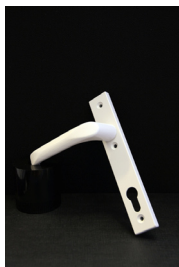
Vitt handtag cylinderlås Standard till entrédörrar.