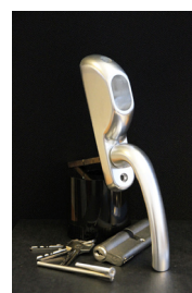
Silvrigt handtag vid Assalås 625kr Passar till inåtgående dörrar.