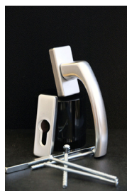
Silvrigt handtag cylinderlås 230kr Passar till utåtgående dörrar. Alternativ. Endast invändigt eller både invändigt och utvändigt.