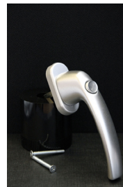
Silvrigt handtag m. knapp 120kr Passar till inåtgående fönster och dörrar.