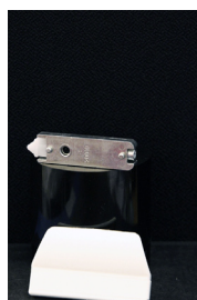
Fjäderbelastat lås 125kr Passar till inåtgående och utåtgående dörrar.