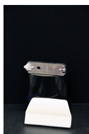
Fjäderbelastat lås 125kr Passar till inåtgående och utåtgående dörrar.