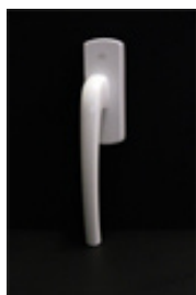
Vitt handtag Standard till glidskjutpartier. OBS! Endast invändigt.