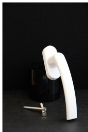
Vitt handtag Standard till inåtgående fönster och dörrar.

Passar till inåtgående fönster och dörrar.