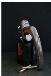
Brunt handtag 150kr Passar till inåtgående fönster och dörrar.