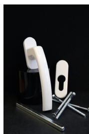
Vitt handtag cylinderlås Standard till utåtgående dörrar. Alternativ. Endast invändigt eller både invändigt och utvändigt.