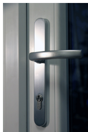
Silvrigt handtag cylinderlås 230kr Passar till entrédörrar.