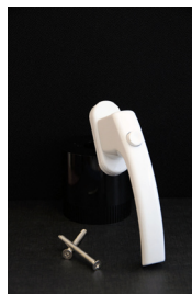
Vitt handtag m. knapp 120kr Passar till inåtgående fönster och dörrar.